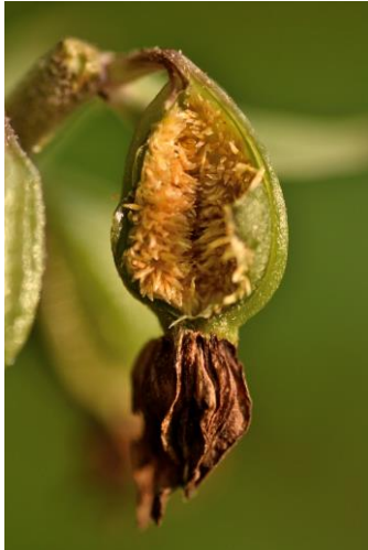
Kapsel von Epipactis purpurata