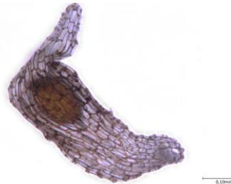
Same von Epipactis purpurata