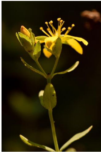
Blüten von Hypericum humifusum