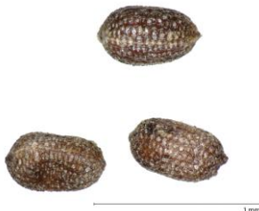
Samen von Hypericum humifusum